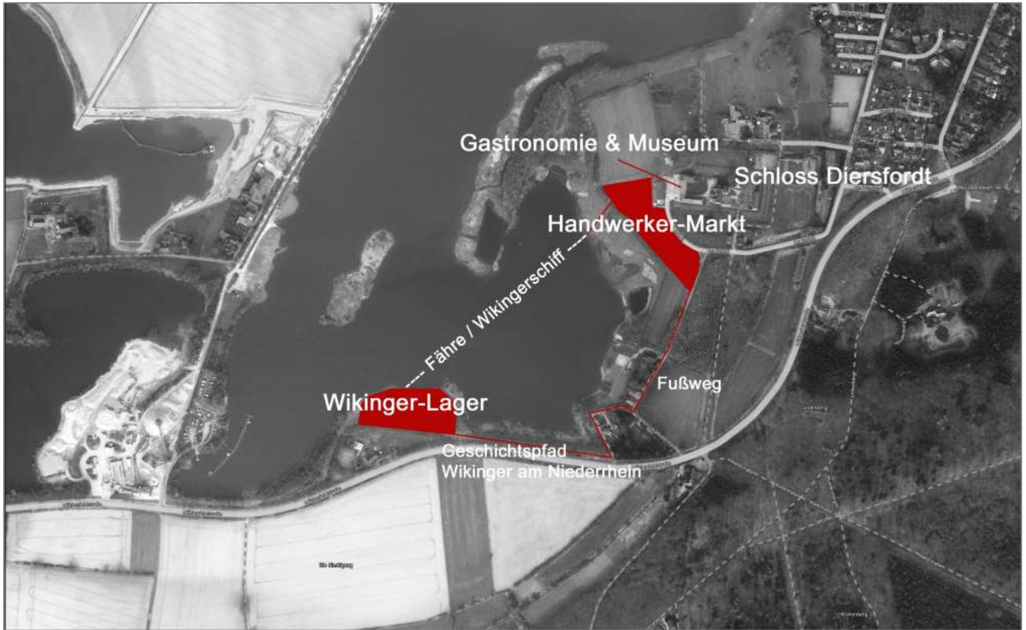
Abbildung 1: Veranstaltungsplan